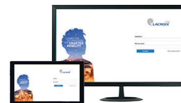
Plateforme web LX Connect Fonctions Tegis Astroconnect (voir p : 56-59)