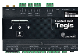
Unité de contrôle Tegis Astroconnect (voir p : 50-51)